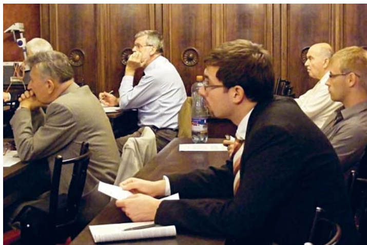
Účastníci Evropského klubu I.